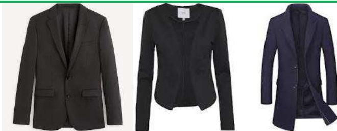
Veste, blazer, manteau de ville, pull de couleur sombre...