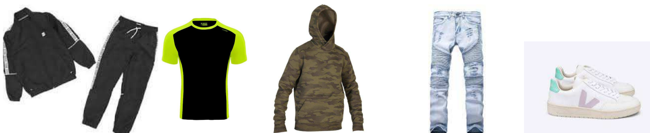
Pas de T-shirt, de jogging, de sweat à capuche, de jeans, de legging, de baskets...