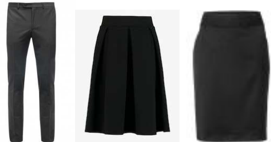
Pantalon de toile ou de ville, jupe haute ou longue, tailleur, de couleur sombre...