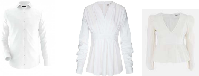
Chemise et chemisier, de couleur blanche...