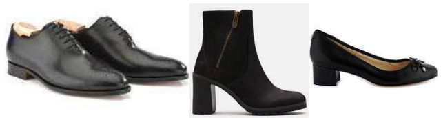
Chaussures de ville, bottines, ballerines de couleur sombre...